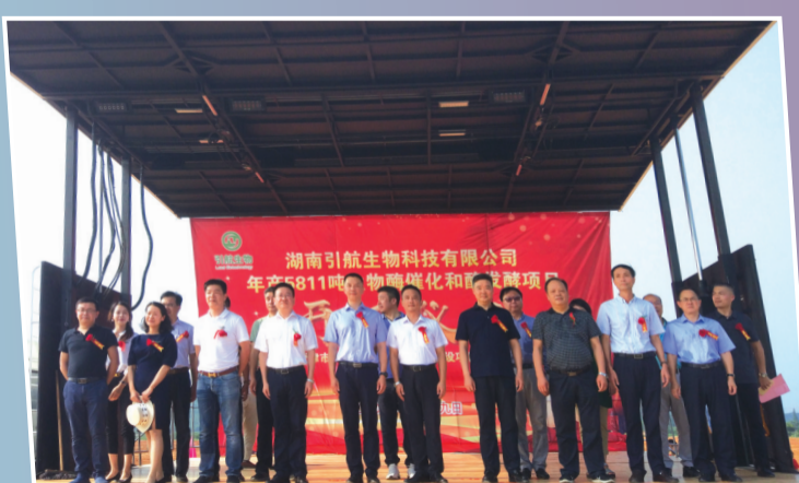
津市引航生物开工仪式现场