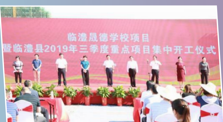
临澧晟德学校开工仪式现场