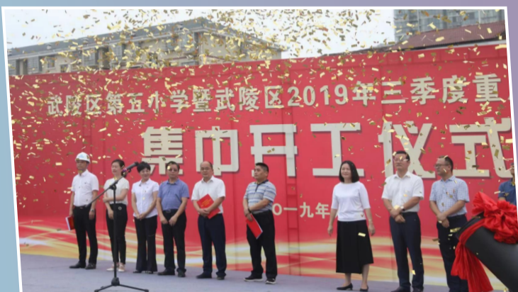
武陵区第五小学开工仪式现场

湘佳牧业优质鸡养殖基地: 项目分别位于石门县新铺镇中和铺村(2个)、夹山镇西周村(1个)、夹山镇两合村(1个),共建鸡舍50栋,占地总面积397亩,总投资3亿元。项目全部建成投产后,年优质鸡养殖规模可达1250万羽,年创养殖销售