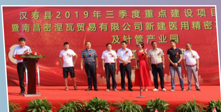
汉寿县密涅瓦医疗器械产业园开工仪式现场