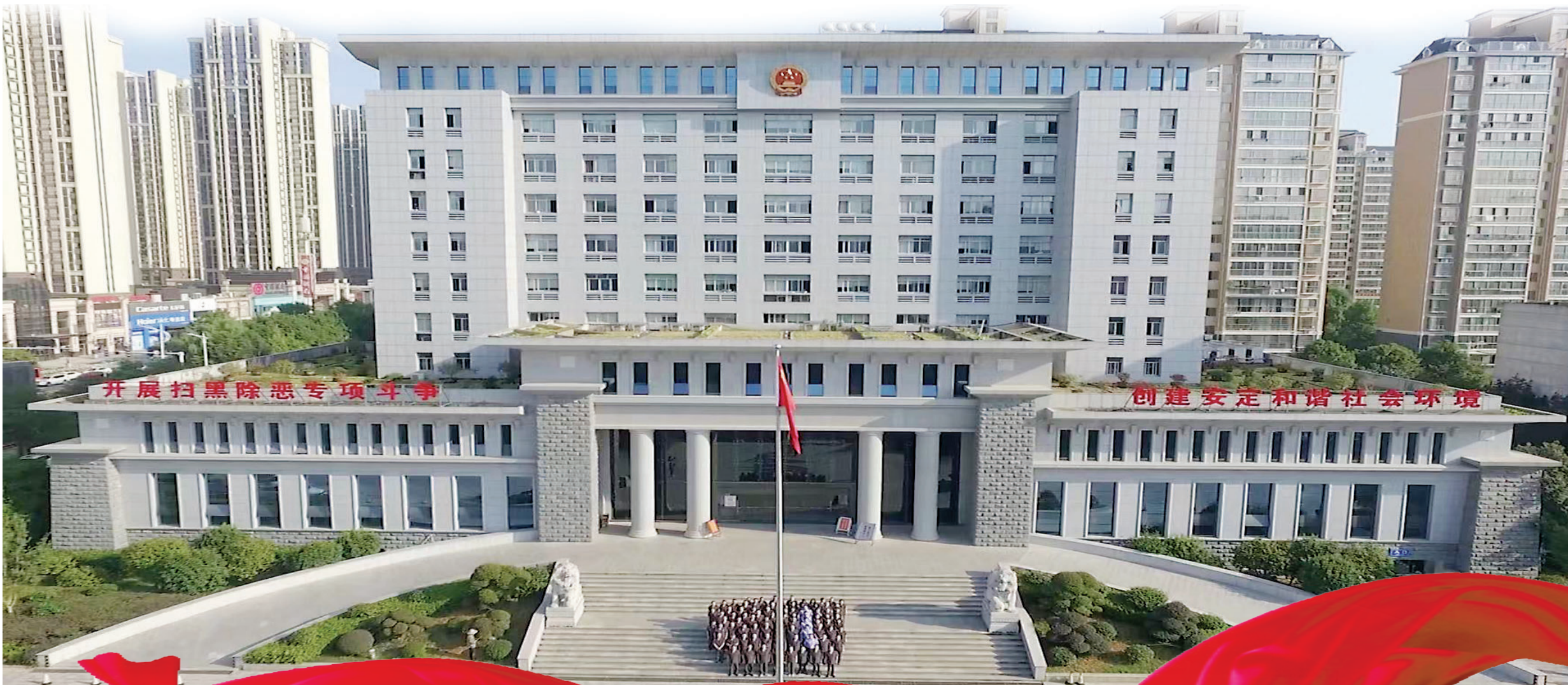
武陵区人民法院新办公大楼