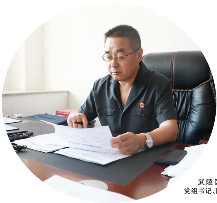
武陵区人民法院党组书记、院长鲁祖方

今年是新中国成立70周年。70年砥砺奋进,我们的国家发生了天翻地覆的变化。无论是在中华民族历史上,还是在世界历史上,这都是一部感天动地的奋斗史诗。为庆祝新中国成立70周年,今日本报特推出与共和国同成长的武陵区人民法院的专题报道。透过武陵区人民法院的成长历程,我们仿佛看到了我国社会主义法治和人民司法事业的壮丽征程。