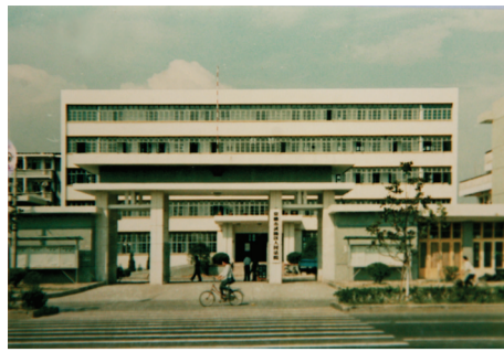
武陵区人民法院老办公楼