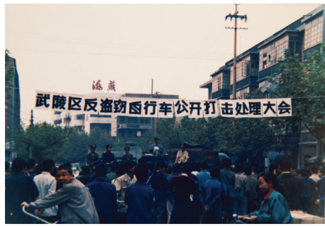
反盗窃自行车公开打击处理大会