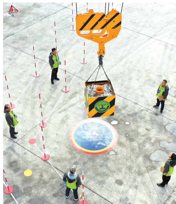
1吨重的物体要准确放在指定区域,考核选手“快、准、稳”的操作综合能力。