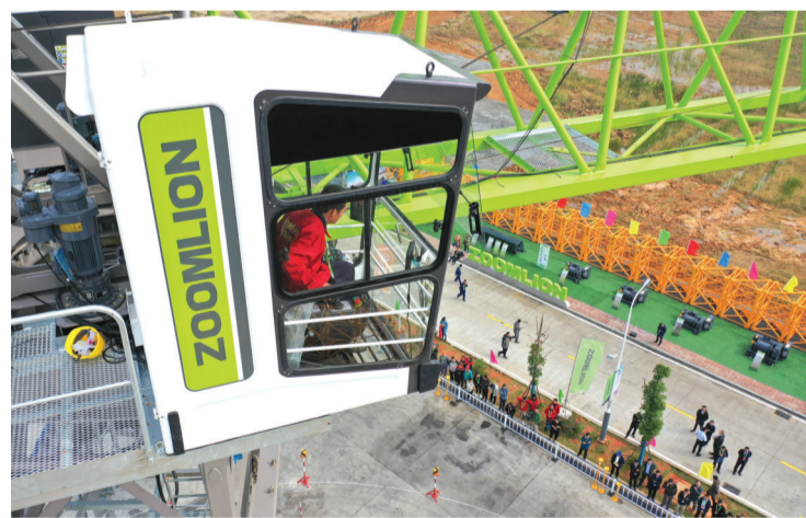
参赛选手操作塔机。