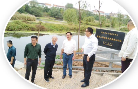
澧县老区办的工作人员在农民暴动遗址前讲述当年农民暴动的革命故事。

最近几年,澧县姚大日、杜修岳、高守泉、刘敦秋、刘大发等一批老干部、老党员、老专家,一心赴在还原历史真相,弘扬红色基因,锁定革命地点、寻访烈士后人、出版老区书刊的征途上,其过程有遗憾、有欣喜、有心愿。澧县县委书记廖可元说,全县广大共产党员、各级干部和人民群众,都要学习党史、军史和老区革命史,真正让红色基因植根于澧州大地,并一代代传承下去。