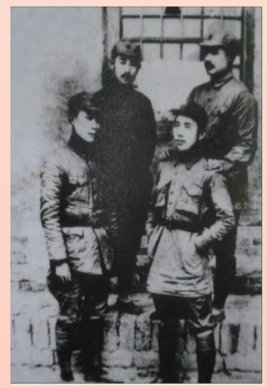
1935年8月28日,红二、六军团攻占澧州后,贺龙(后右)、任弼时(后左)、王震(前左)、关向应(前右)在澧县苏维埃政府(原城北天主教堂)门前合影。