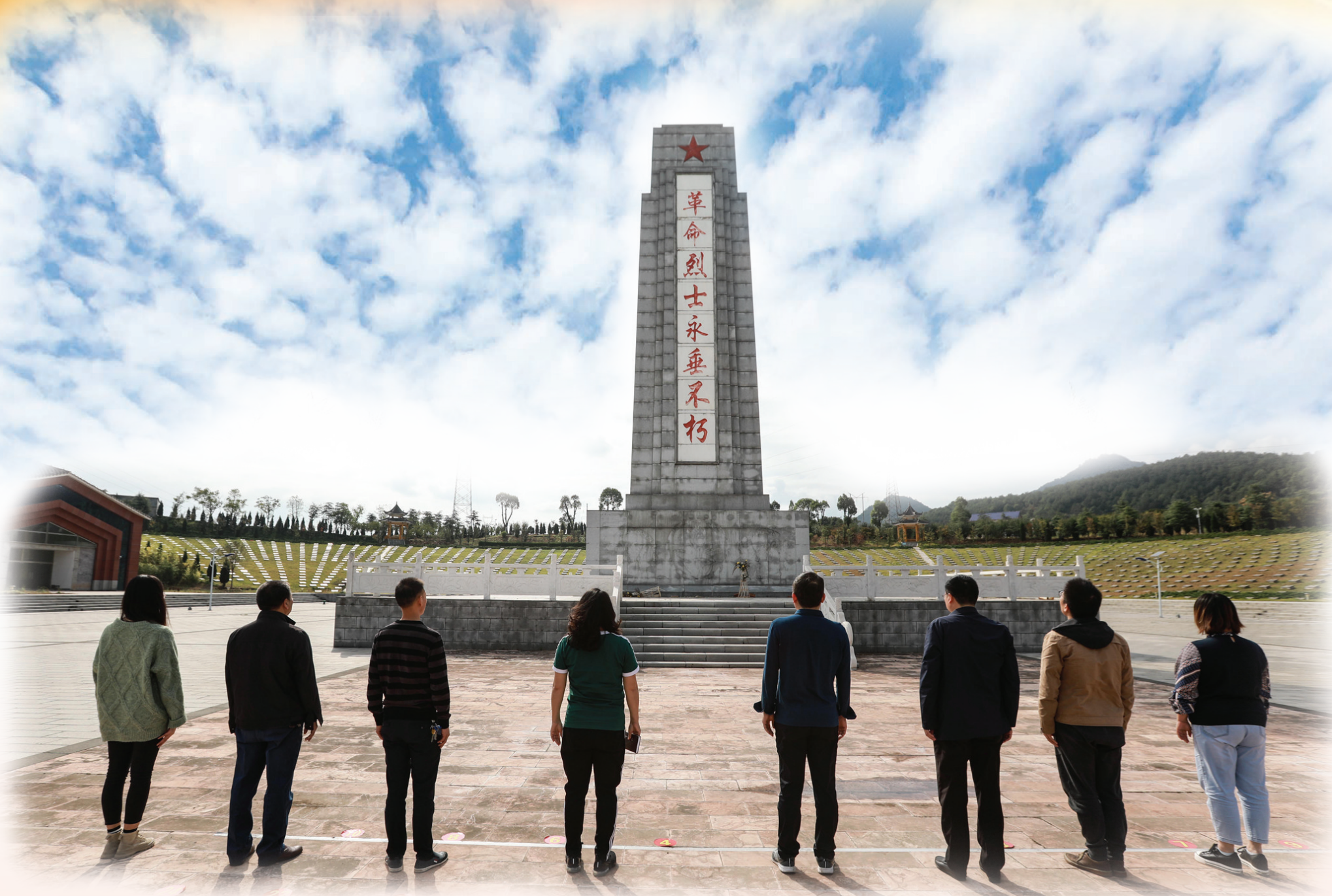
采访团一行来到石门烈士陵园祭奠英烈。

石门南乡起义与毛泽东领导的秋收起义,彭德怀领导的平江起义,朱德、王尔琢领导的湘南起义,贺龙领导的桑植起义,被称为土地革命时期湖南省5大农民起义。2011年,石门南乡起义入选新版《中国共产党历史大辞典》;新民主主义革命时期(包括土地革命时期),在中国共产党领导下的农民武装起义86起,石门南乡起义排第41位。