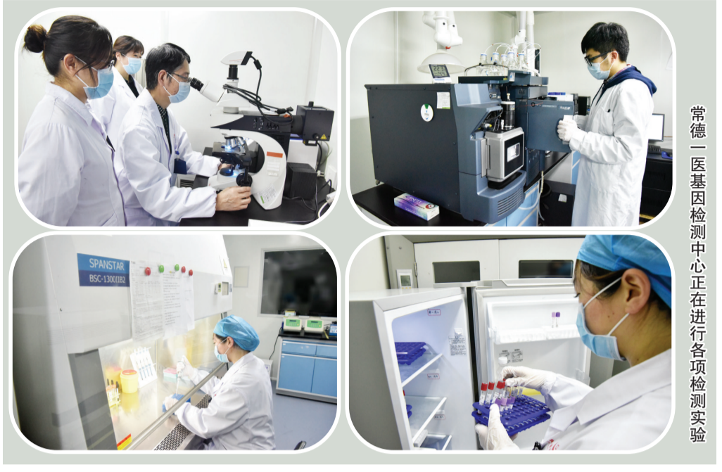
常德一医基因检测中心正在进行各项检测实验

该中心硬件设备齐全先进,现已搭建了实时荧光定量PCR、FISH、一代测序、二代测序、质谱分析等检测技术平台,相关仪器设备总价值超过1000万元,包括ABI3130xl测序仪、ABI7500